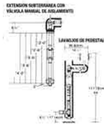
Al especificar una unidad de tipo pedestal, incluya una descripción escrita de las opciones deseadas.